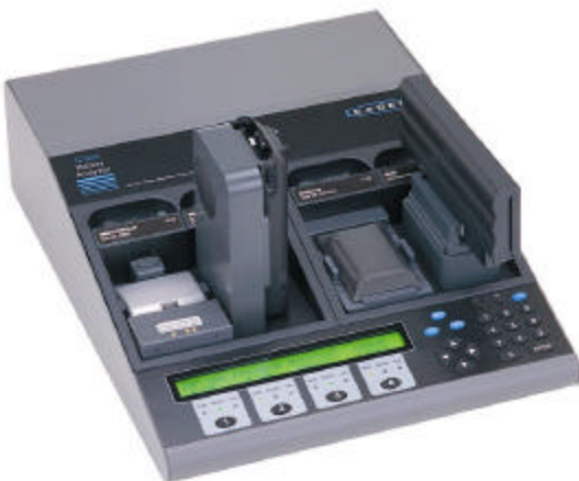
Abbildung 4: Cadex 7400 Akku-Analyser mißt den Innenwiderstand.

Cadex hat ein eigenständiges pulsierendes Verfahren entwickelt, um den Innenwiderstand der Akkus zu messen. Bekannt als OhmTest , wird der Wert in Milliohm ( m\Omega ) innerhalb von zehn Sekunden ermittelt, ohne daß der Akku entladen wird. Als ein Bestandteil der C7000 Akku-Analysen Serie läßt sich mittels des OhmTestes eine große Anzahl Akkus innerhalb Minuten durchprüfen. Diese Technik ist bei Unternehmen besonders nützlich, die Mengen von Akkus auf ihre Leistungswerte hin überprüfen müssen, bevor sie freigegeben werden.